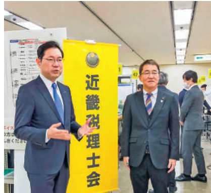
勝目康 衆議院議員