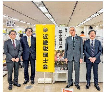
西田昌司 参議院議員