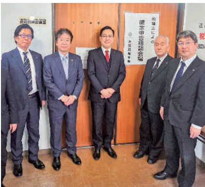
杉 久武 参議院議員