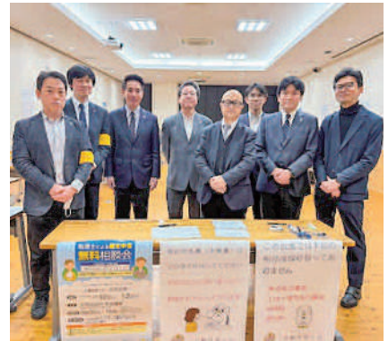
前原誠司 衆議院議員