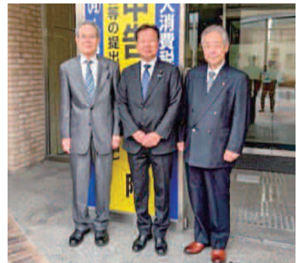
大串正樹 衆議院議員