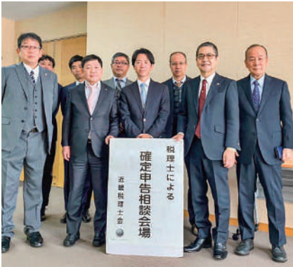
宗清皇一 衆議院議員