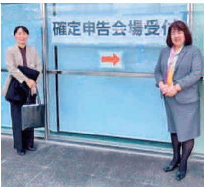
伊藤孝江 参議院議員