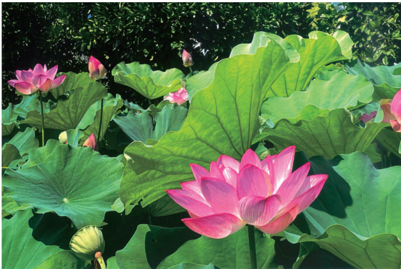
生駒の蓮 (第3回写真コンテスト「幹事長特別賞」)

〒540-0012 大阪市中央区谷町1丁目5番4号 電話(06)6944-9040 FAX(06)6944-9050 URL https://kinzeisei.jp/ e-mail info@kinzeisei.jp