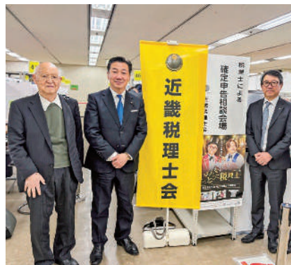
福山哲郎 参議院議員