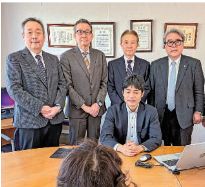
盛山正仁 衆議院議員