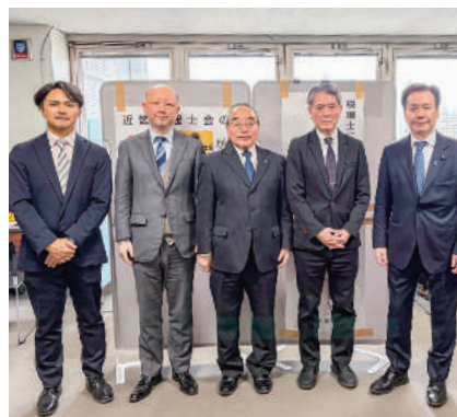
こやり隆史 参議院議員