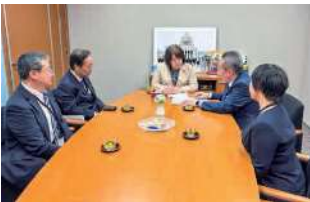
伊藤孝江 参議院議員