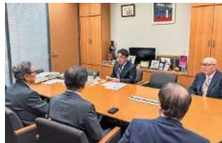
うえの賢一郎 衆議院議員