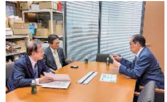
松本剛明 衆議院議員