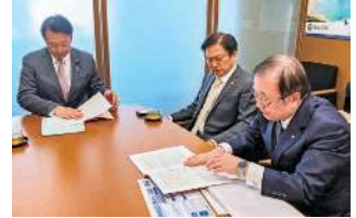
吉井章 参議院議員