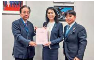
松川るい 参議院議員