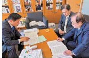
福山哲郎 参議院議員