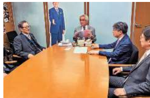
西田昌司 参議院議員