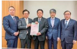
北側一雄 衆議院議員