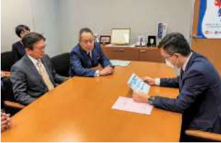
杉久武 参議院議員

10月24日、衆・参議員会館を訪問し、一斉陳情をおこない「令和6年度税制改正に関する要望」が実現できるように協力を求めた。 (陳情先国会議員は写真の通り、訪問順)