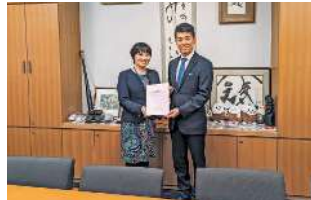
泉健太 衆議院議員