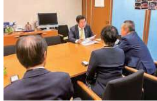
加田裕之 衆議院議員