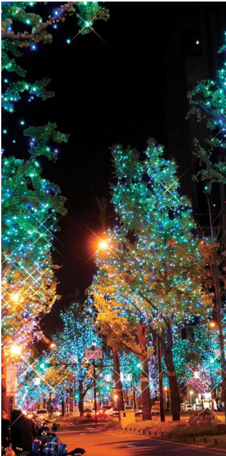
御堂筋イルミネーション(大阪市)

URL https://kinzeisei.jp/ e-mail info@kinzeisei.jp