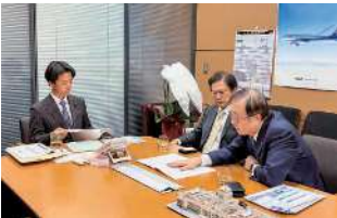
宗清皇一 衆議院議員