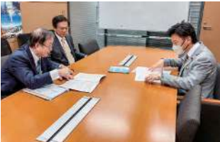
池下卓 衆議院議員