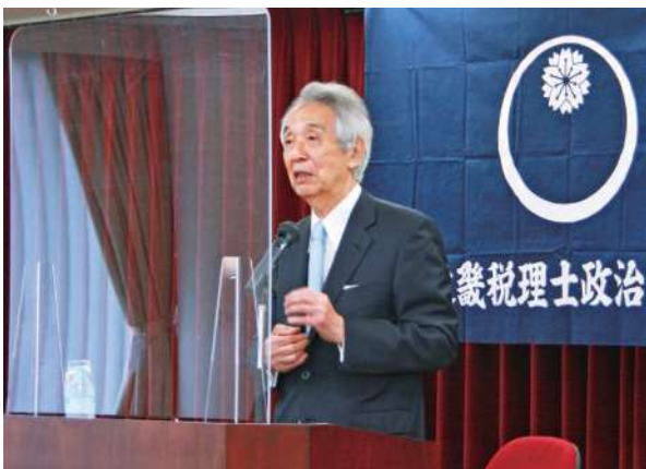
伊吹文明 元衆議院議長