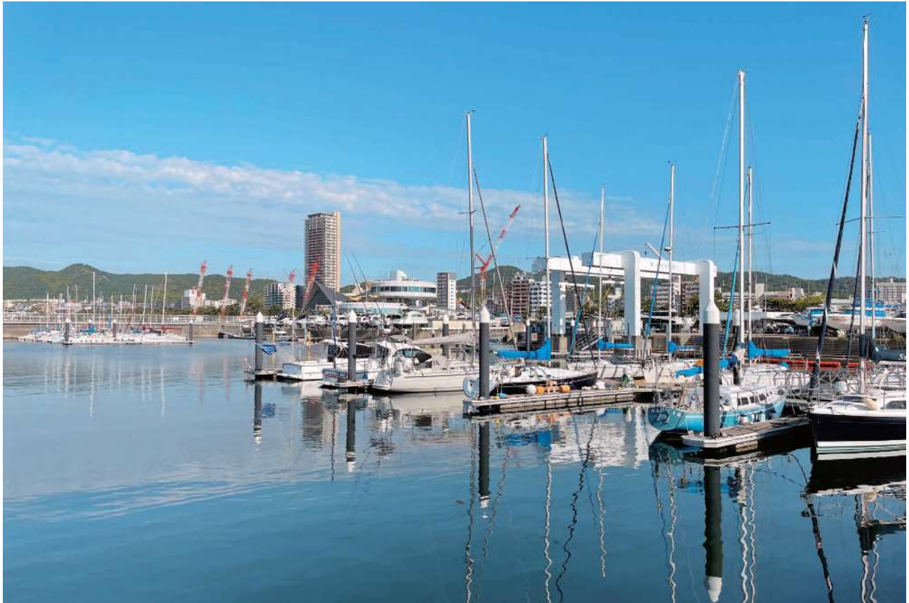
須磨ヨットハーバー（神戸市）