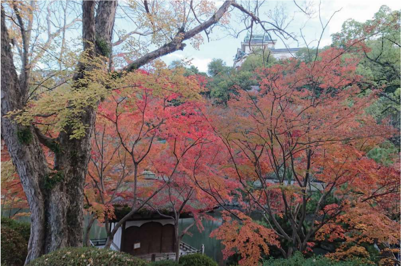
紅葉溪庭園から望む和歌山城(和歌山市)